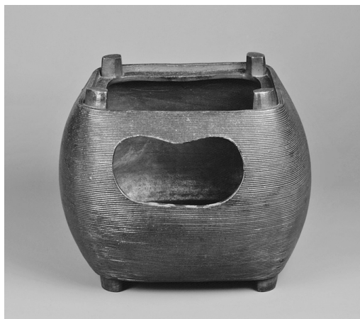
糸巻風炉 無限齋好 金重陶陽作