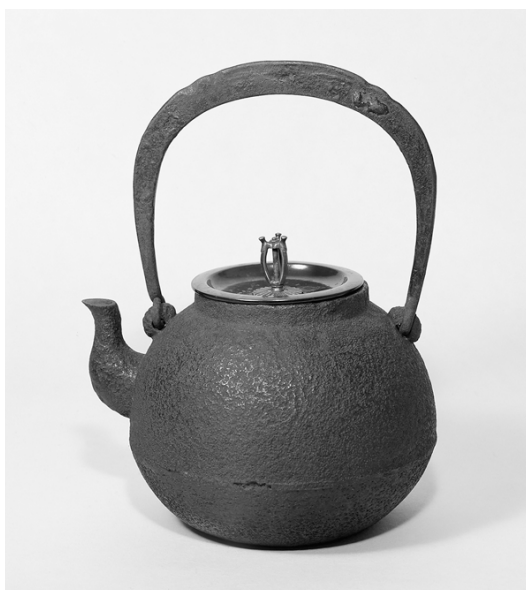
常盤形鉄瓶 無限齋好 大西浄中作