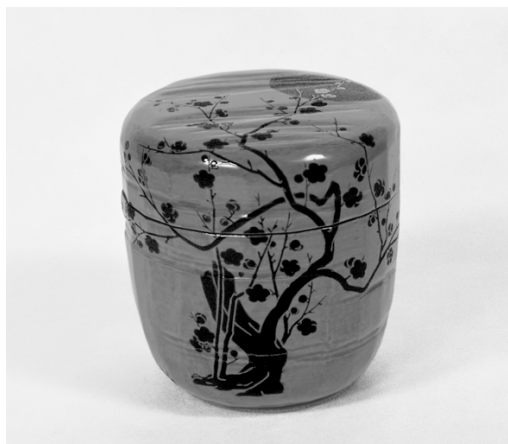
梅月棗 無限齋好 十一代中村宗哲・十四代飛来一閑合作