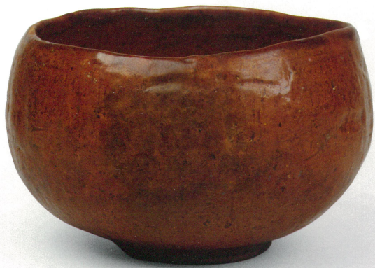
赤茶碗 銘イカ栗 裏千家四代仙叟作 今日庵蔵