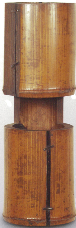
竹輪無二重切花入 銘布引 裏千家五代常叟作 今日庵蔵